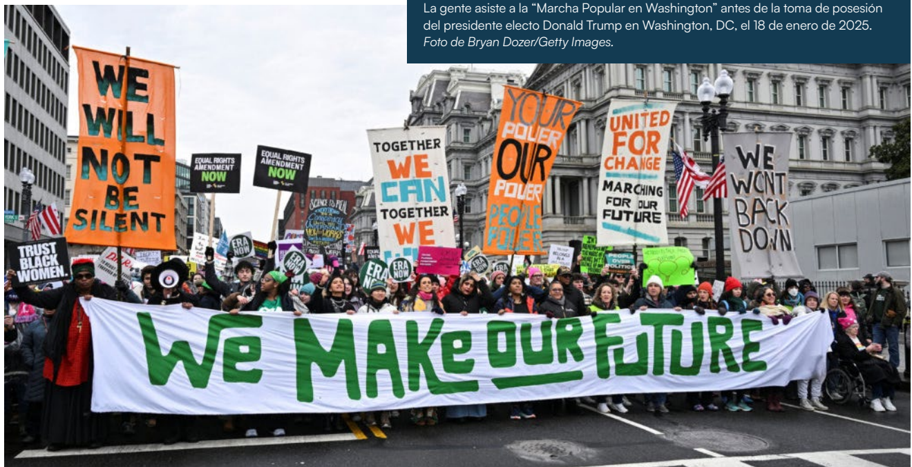
La gente asiste a la "Marcha Popular en Washington" antes de la toma de posesión del presidente electo Donald Trump en Washington, DC, el 18 de enero de 2025.

los últimos 18 meses, las fuerzas militarizadas en las ciudades y los campus universitarios han reprimido violentamente la libertad de expresión y han criminalizado la organización comunitaria en favor de la paz. Pero hemos visto repetidamente que la vigilancia policial racializada de nuestras comunidades no mejora la seguridad, sino que crea ciclos de despojo, trauma y muerte.