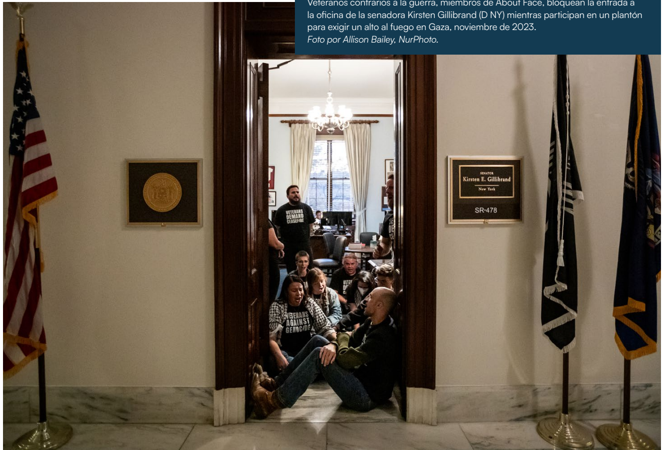
Veteranos contrarios a la guerra, miembros de About Face, bloquean la entrada a la oficina de la senadora Kirsten Gillibrand (D NY) mientras participan en un plantón para exigir un alto al fuego en Gaza, noviembre de 2023.

Introducir resoluciones y marcos políticos que articulen y promuevan los principios feministas de paz, garantizando la coordinación con los líderes del movimiento. Los responsables políticos deben colaborar activamente con los defensores feministas por la paz y las comunidades afectadas para desarrollar políticas que den prioridad a la seguridad comunitaria, la cooperación internacional y la desmilitarización.