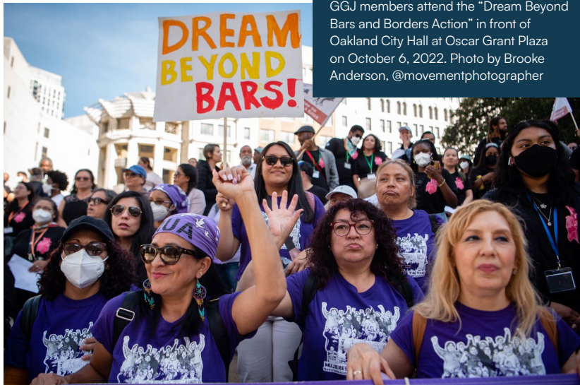
GGJ members attend the “Dream Beyond Bars and Borders Action” in front of Oakland City Hall at Oscar Grant Plaza on October 6, 2022.